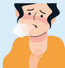
Batuk/ Pilek/ Nyeri Tenggorokan/ Sesak

Jika YA, segera hubungi Call Center 112 untuk dilakukan diagnosa melalui telepon dan konfirmasi gejala akan dilakukan oleh petugas kesehatan dengan mendatangi langsung ke rumah.