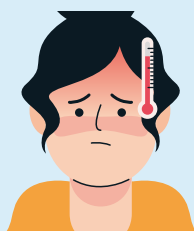
Demam atau riwayat demam